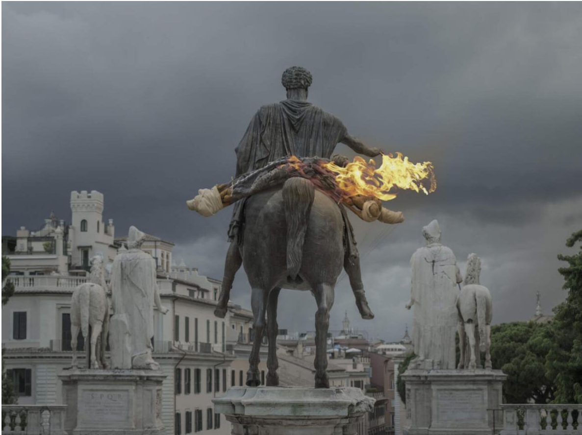
Treti Galaxie, Endless Nostalghia – immagine: Monia Ben Hamouda

16.00 -16.45 + 15 min. considerazioni, domande ed interventi degli studenti