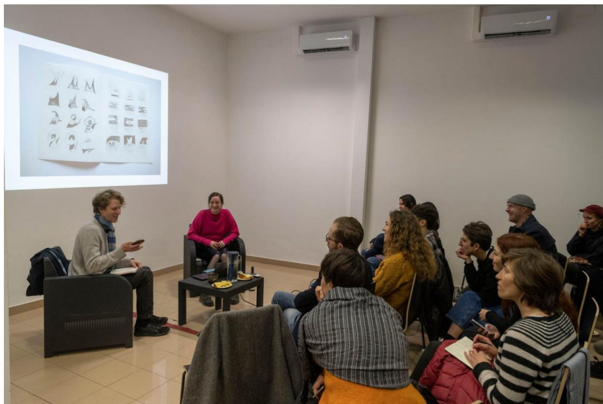
CASTRO projects, Roma

17.00 -17.45 + 15 min. considerazioni, domande ed interventi degli studenti