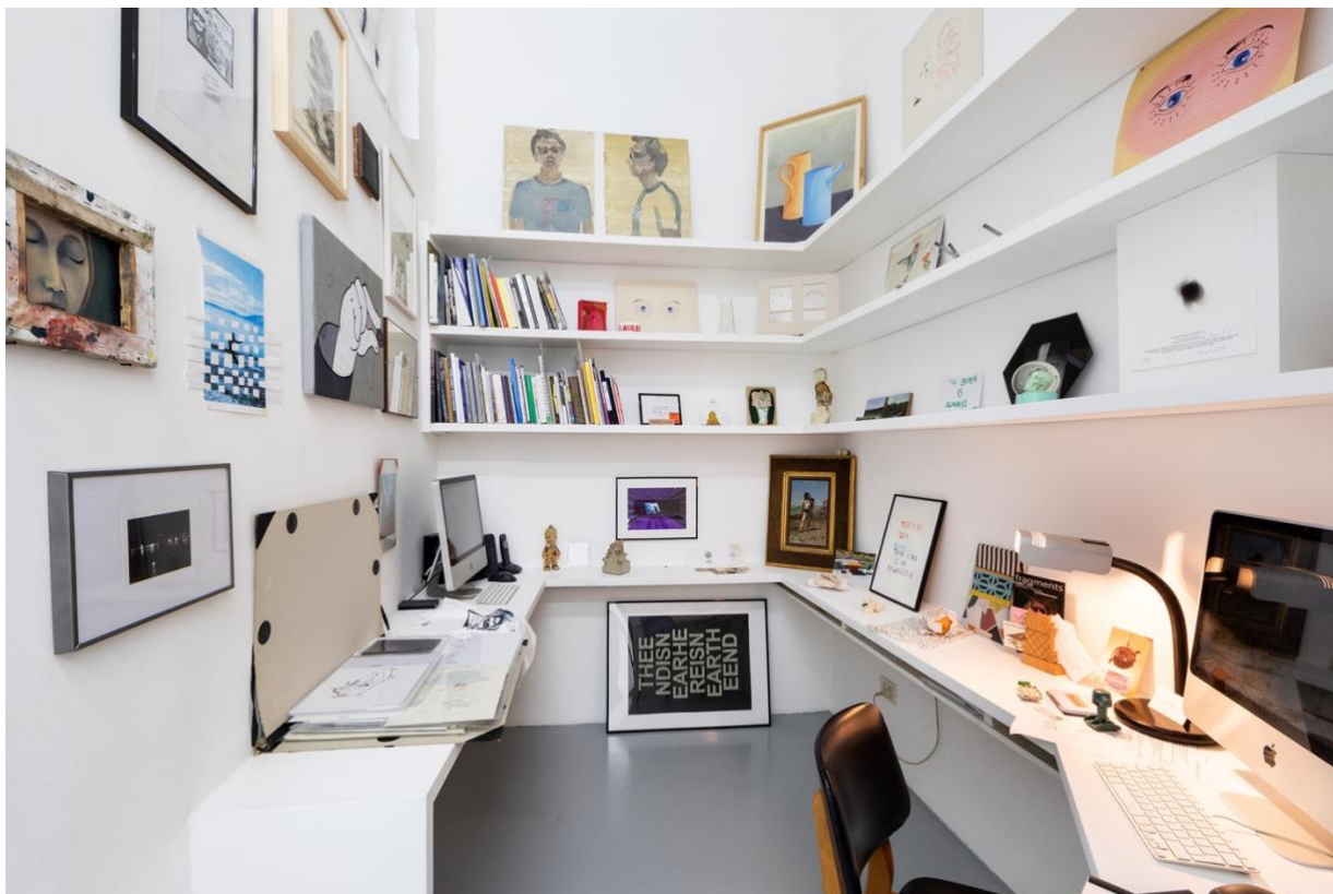
Flip Project, The uncertainty of space-time: a constellation of parallel worlds through the obsession of collecting. Umberto Di Marino Arte Contemporanea

Gli Artist-run-spaces sono da sempre motivo di 'case study' all'interno del vasto sistema dell'arte avendo contribuito alla ricerca e promozione della sperimentazione contemporanea italiana ed internazionale, così come all'esplorazione di nuovi modelli di relazione con il pubblico e con le istituzioni.